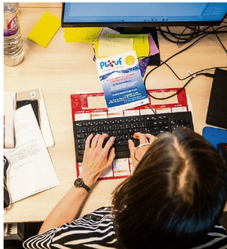
73 % des femmes journalistes ont déjà été victimes de violences en ligne dans le cadre de leur travail.

La plupart des commentaires violents sont postés par des personnes qui ne cachent pas leur identité. On est loin du troll d'internet qui pollue l'espace commentaire pour le plaisir. On peut facilement retrouver leur identité, avec qui ils sont amis, leur travail, etc.