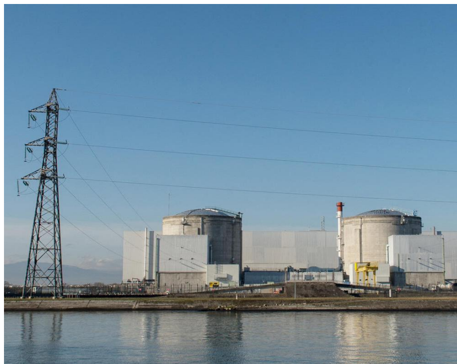
Fessenheim (Haut-Rhin). Alors que la précédente programmation pluriannuelle de l'énergie prévoyait la fermeture de 14 réacteurs nucléaires, la nouvelle version prévoit la construction de 6 nouvelles unités.

Et les renouvelables ? C'est sans doute sur ce volet que les évolutions ont été les plus sensibles ces derniers mois. Sans annoncer un moratoire sur l'éolien ou le solaire, ce qui constituait une forte crainte de la filière, cette nouvelle programmation de l'énergie donne un sérieux coup de frein à son expansion. « On poursuit l'investissement dans les énergies renouvelables pour ce qui est produit en France,