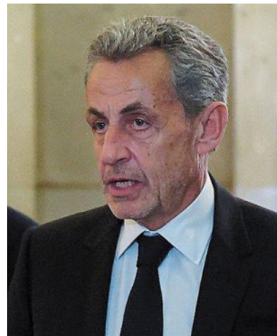
Nicolas Sarkozy, ici lundi à son procès, est actuellement jugé en appel.

L'ex-ministre Brice Hortefaux, 67 ans, condamné à deux ans de prison aménagés sous bracelet électronique, a également réaffirmé son innocence mercredi. Affirmant qu'il « prouverait » que tout ce qui lui était reproché était « rigoureusement faux [...]. Il n'y a pas un matin où je ne m'éveille sans m'interroger