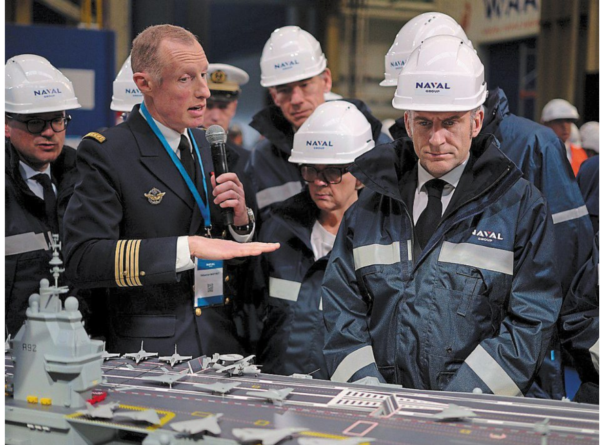
À travers le chantier du porte-avions nouvelle génération France Libre, Emmanuel Macron martèle la nécessité d'une Europe de la défense.

France Libre et ses 77 000 tonnes pour 310 m de long représentent 10 milliards d'euros d'investissement. Ce sera le plus gros navire militaire jamais fabriqué en France. Il entrera en construction dès 2031 à Saint-Nazaire, d'où il partira vers Toulon en 2035 pour être armé et déclaré opérationnel en 2038. Au total, 90 % du budget bénéficiera aux entreprises nationales et contribuera à développer les compétences industrielles en France. Le ruissellement de cette économie de guerre profitera à 800 entreprises et permettra d'employer jusqu'à 14 000 salariés au pic du chantier.